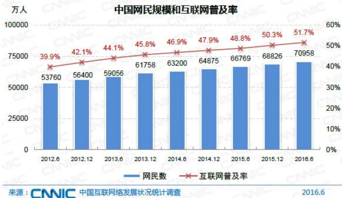
图1.1 中国网民数量和互联网普及率

中国互联网络信息中心(CNNIC)在京发布第38次《中国互联网络发展状况统计报告》显示,截至2016年6月,中国网民数量达7.10亿,互联网普及率达到51.7%,超过全球平均水平3.1个百分点(见图1.1)。