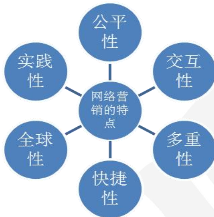
图 1.3 网络营销的特点