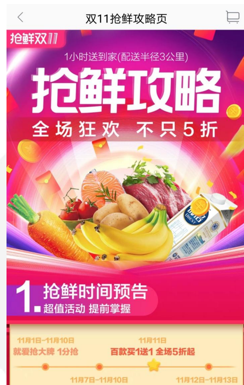
图1.11 手机淘宝淘鲜达页面