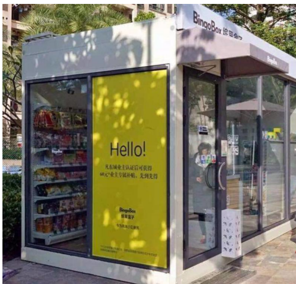
图1.12 缤果盒子无人便利店

问题2：20年来自动售货机一直不温不火，为何无人售货机会成为投资者们竞相投资的对象。